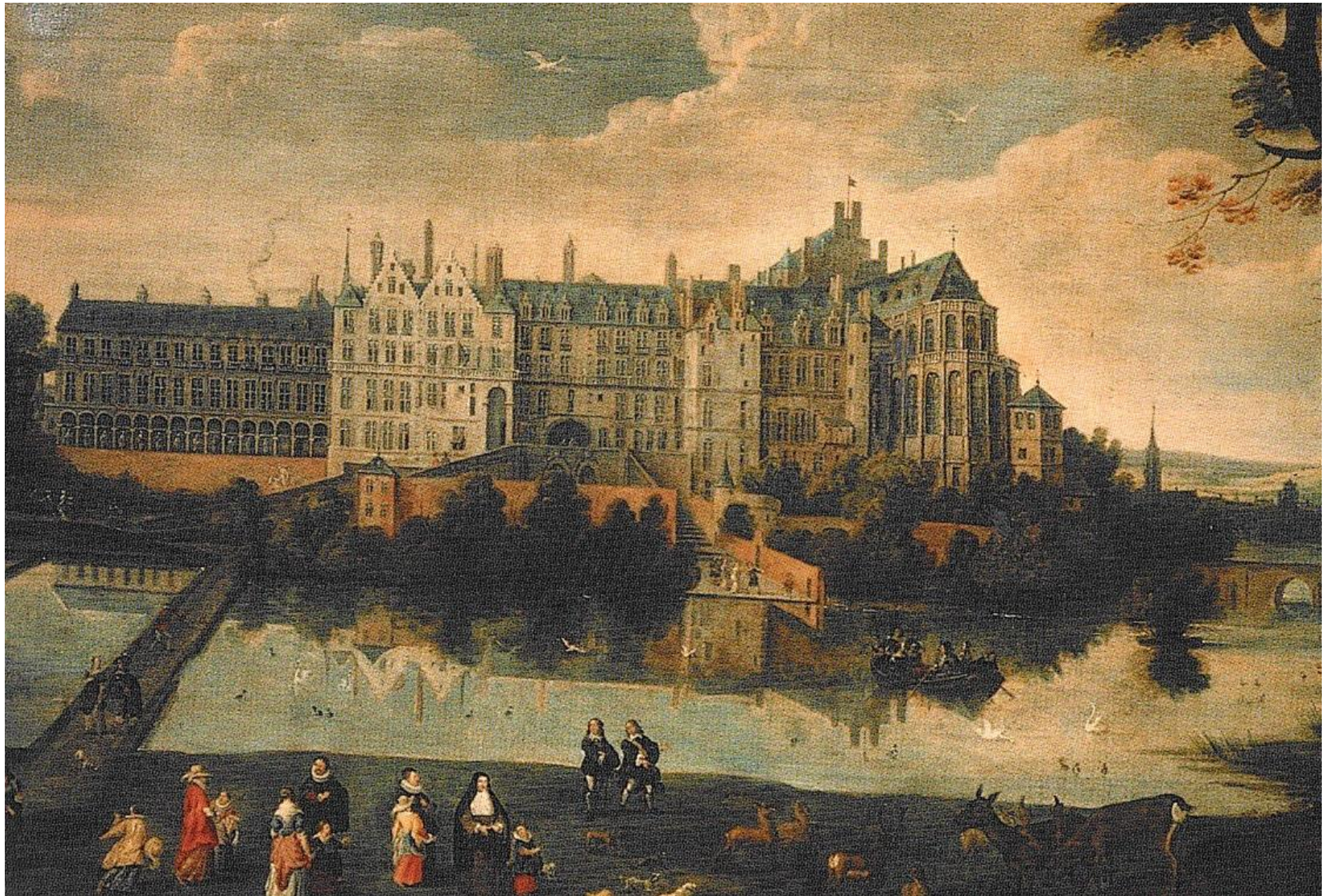
D. en J-B van Beil, Infante Isabella in de tuin van het paleis, olie op doek, 17de eeuw, Broodhuis, Brussel.