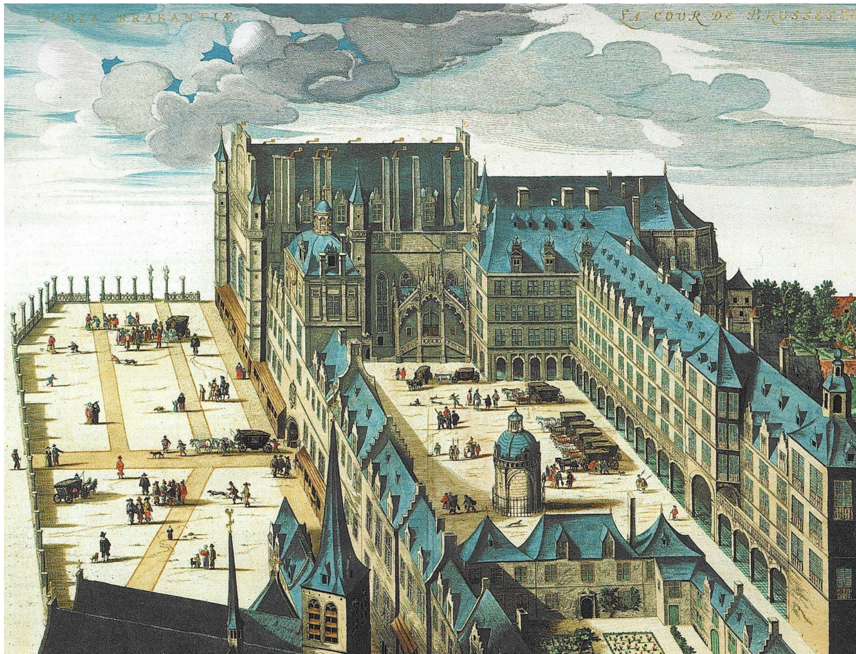
J. Van de Velde, Curia Brabantiae in celebri et populosa urbe Bruxellis, gravure,, 1649, Oostenrijkse nationale bibliotheek, Wenen.