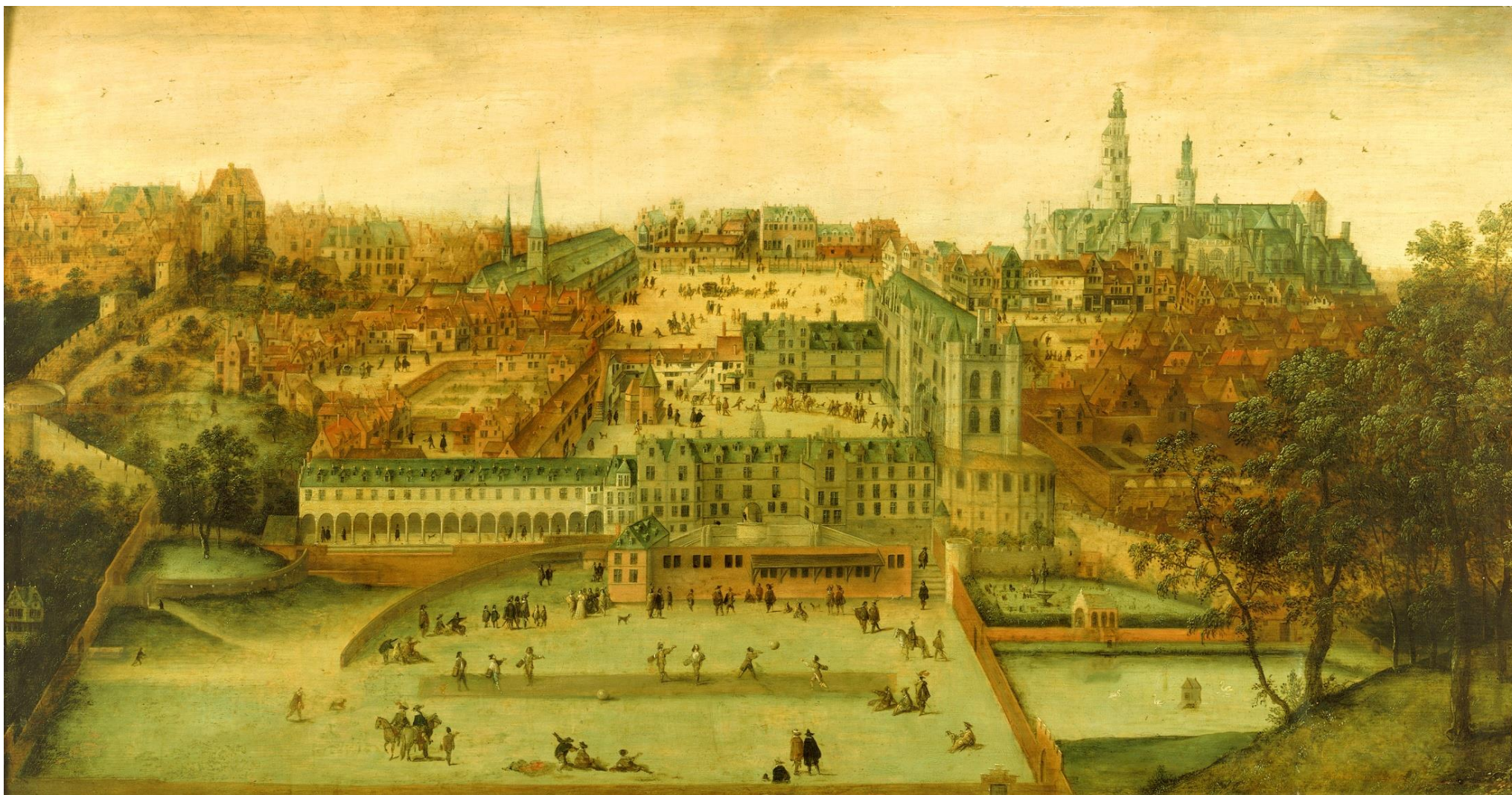
Anoniem, Coudenbergpaleis, olie op paneel, ca. 1548 (overschilderd in de 17de eeuw), Broodhuis, Brussel.

Lesmateriaal: https://www.erfgoedklassen.brussels/lesmateriaal/op-zoek-naar-het-coudenbergpaleis/