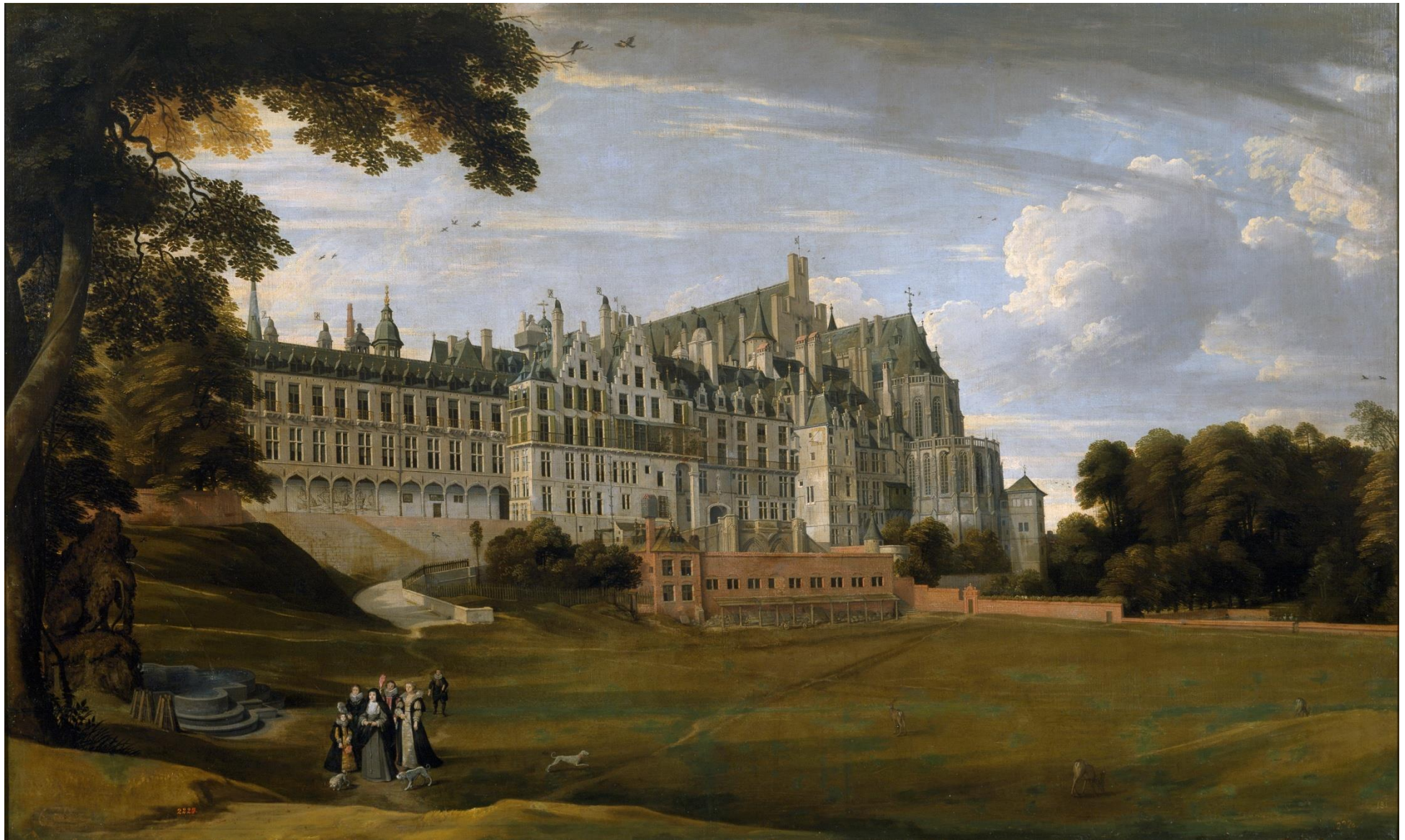
Anonim, Infante Isabella, gekleed als Clarissenzuster in het park van het paleis, olie op doek, 17de eeuw, Prado, Madrid.