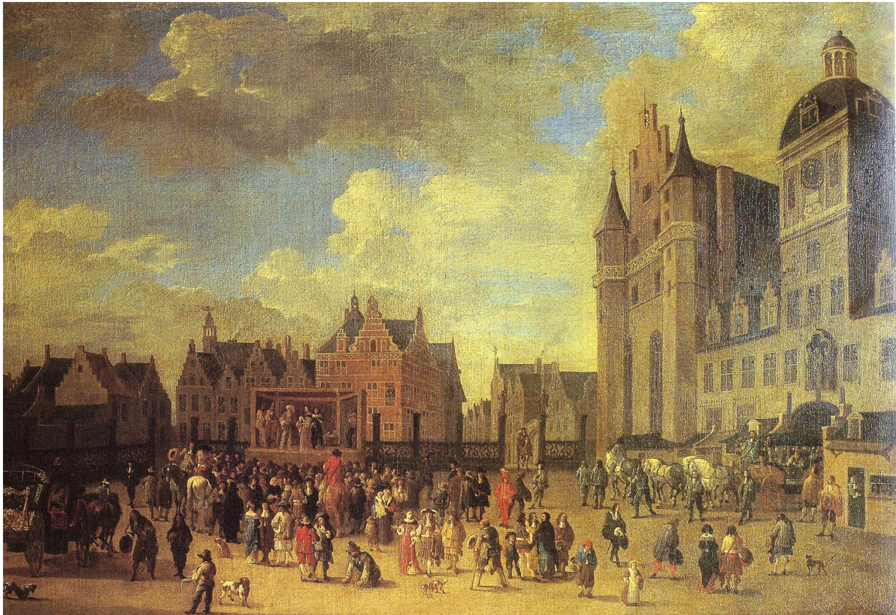
P. Bout, theatervoorstelling op het Baliënplein in de 17de eeuw, olie op doek, begin 18de eeuw, Broodhuis, Brussel.