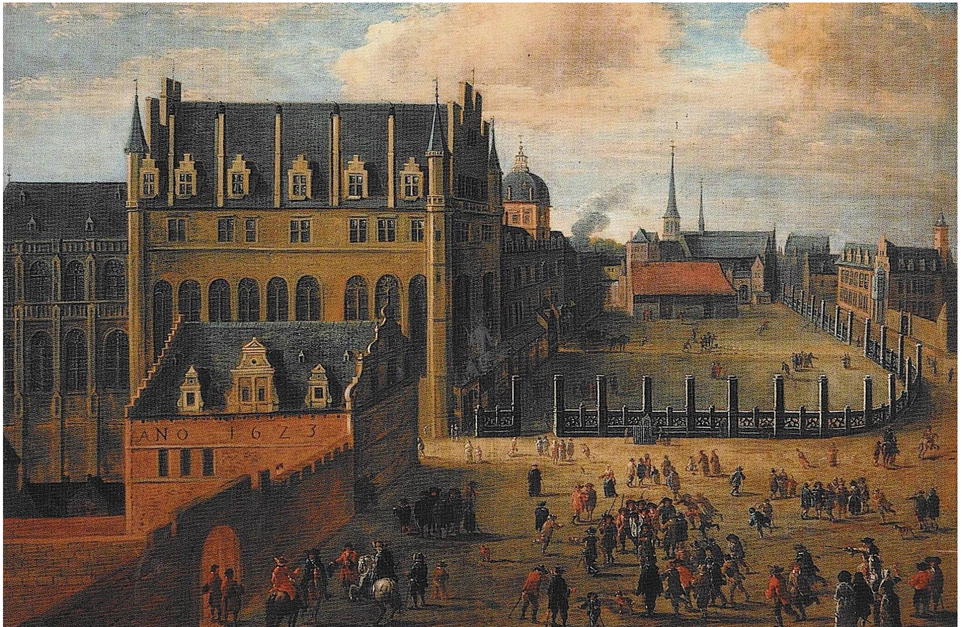
Anoniem (monogram G.V.A.), zicht op het paleis en het Baliënplein, olie op doek, 17de eeuw, Broodhuis, Brussel.