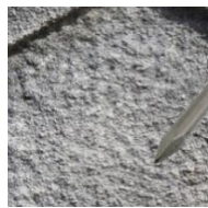
Afwerking met puntijzer