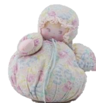
De lappen pop