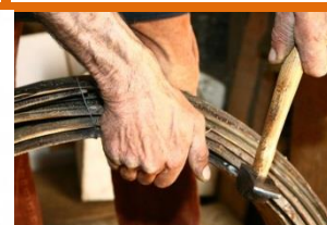
De hoepel van kastanjetakken