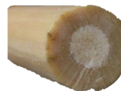
De twijg van een vlierbes