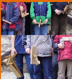
De houten ratel