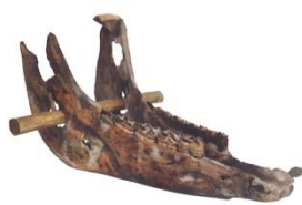
De kaak van een paard