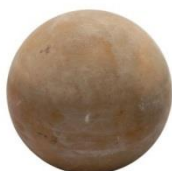
De bal van gebakken aarde