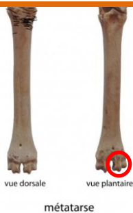
Het bot van een schaap