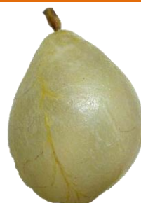
De blaas van een dier (varken,...)