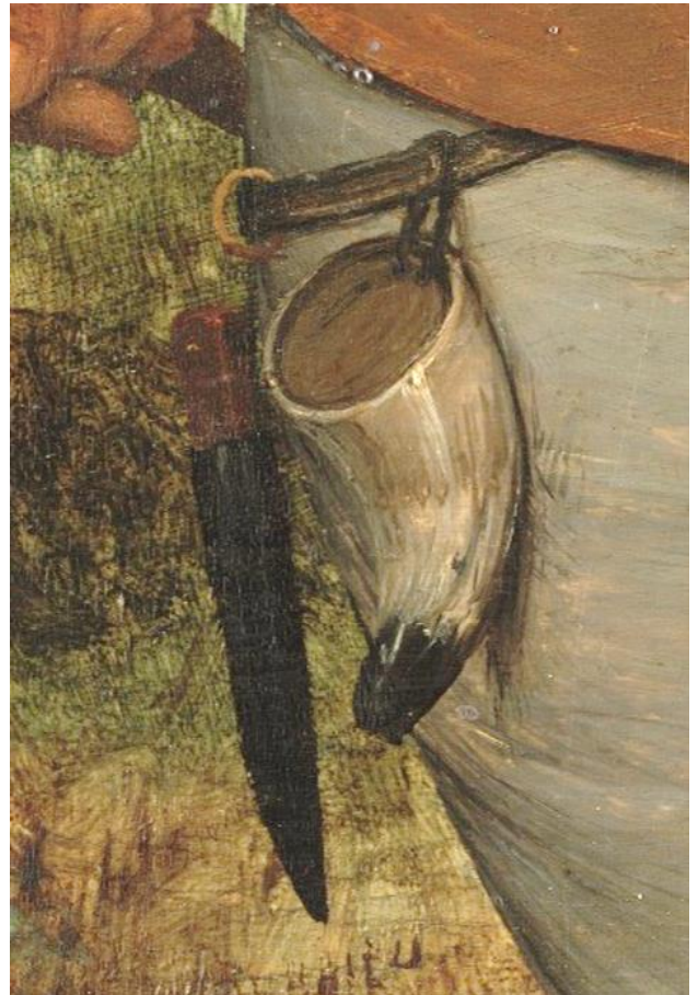
De boer en de vogelnestover