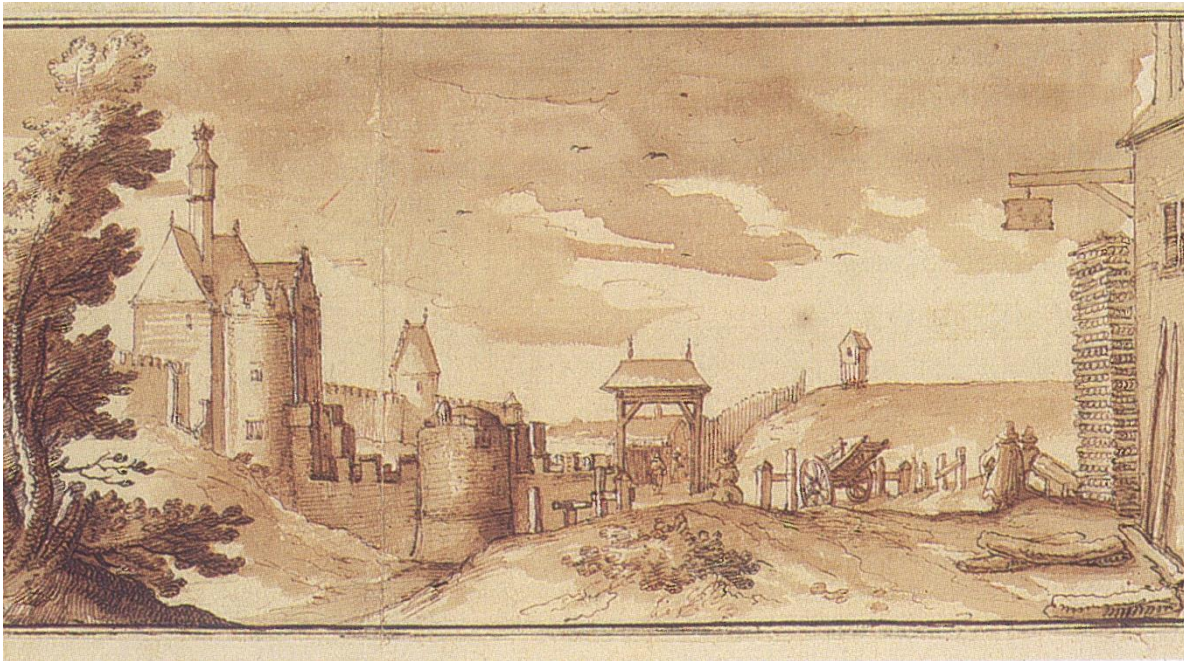
1. Cantagallina R., De Naamse poort , 1613