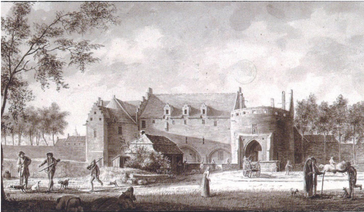
Vitshumb P., de Lakense poort, 1783