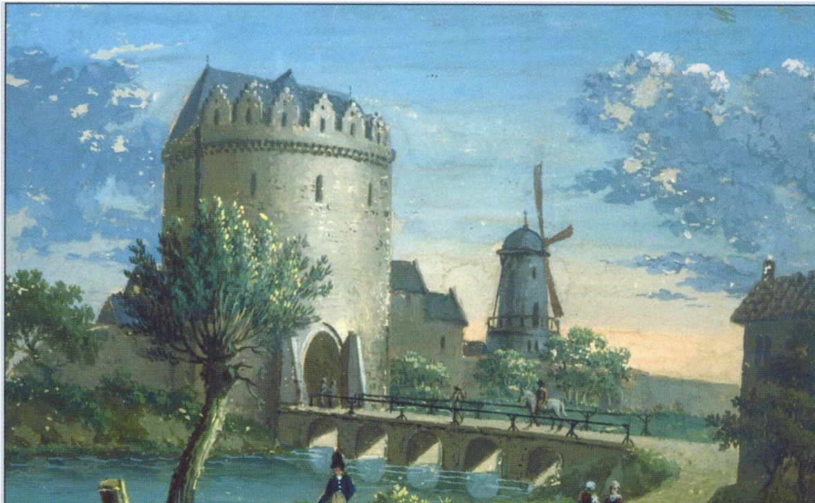
Spaak L., Anderlechtse poort, rond 1780