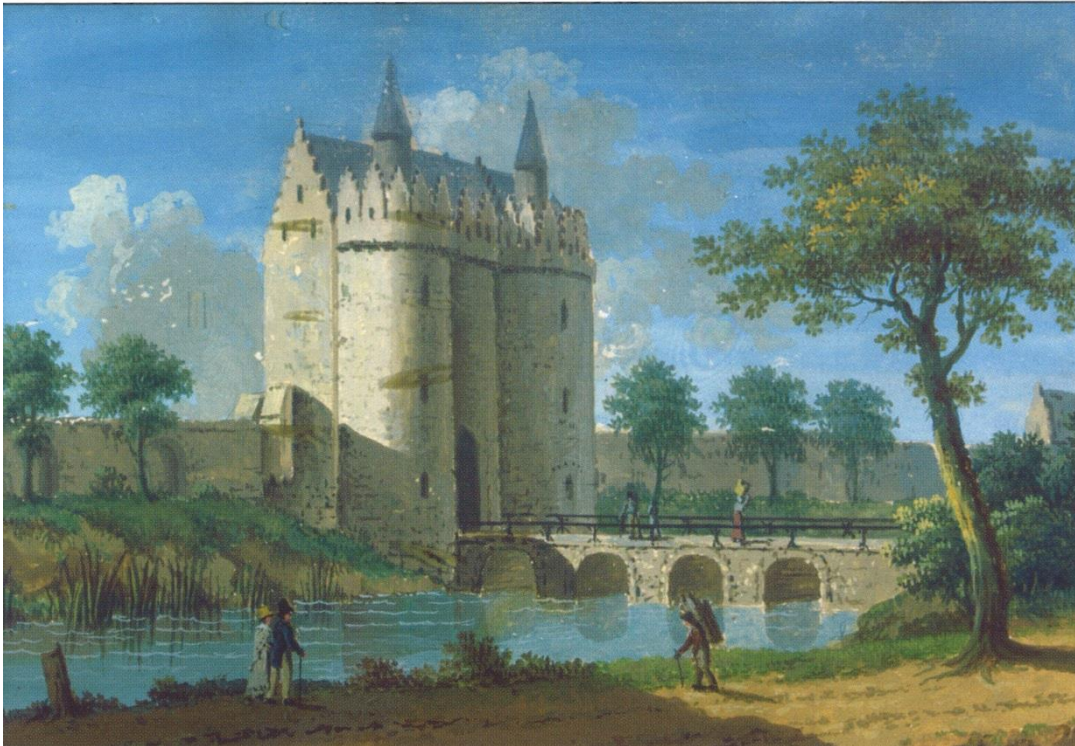
Spaak L., De Vlaamse poort , rond 1780